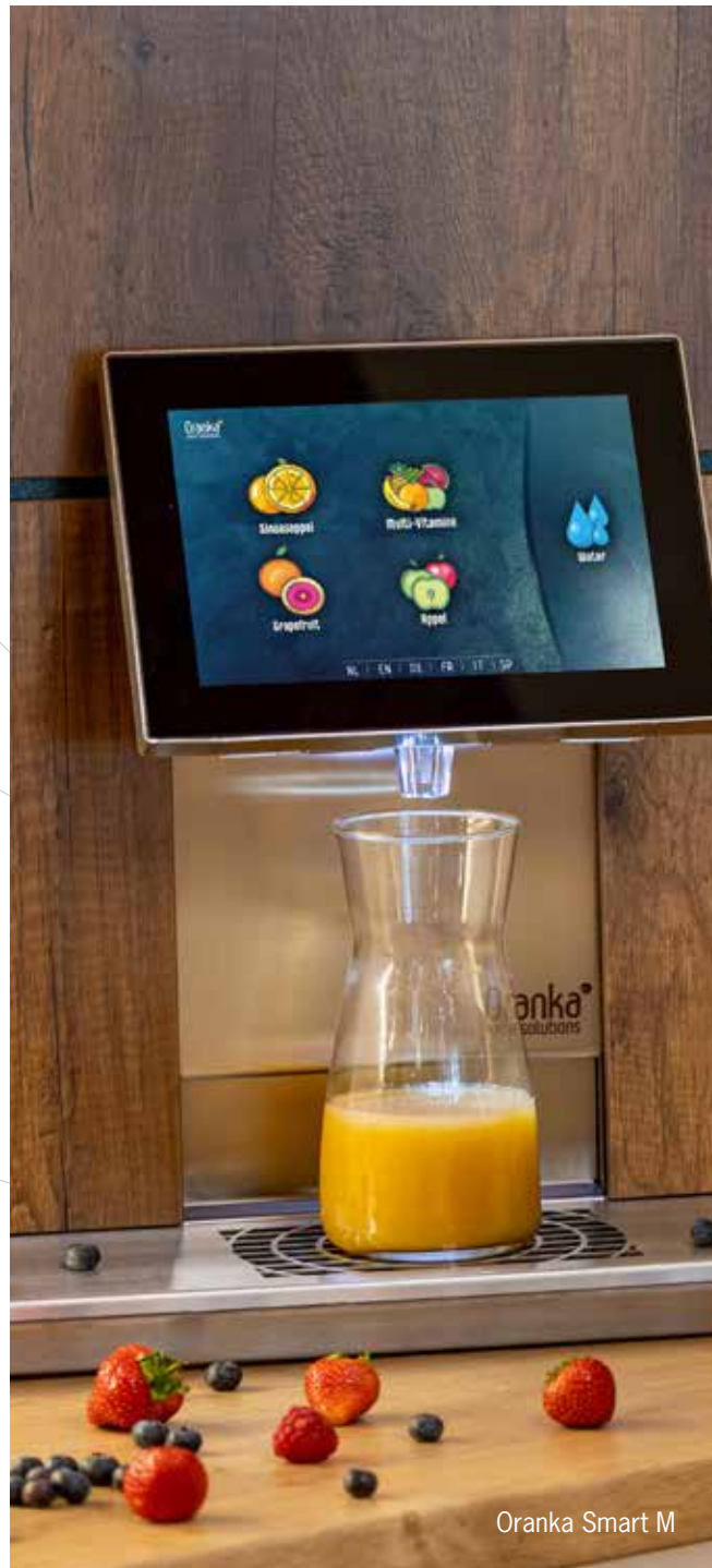
Oranka Smart M