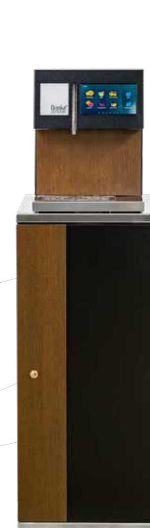
Oranka Tower Smart ECO Oranka Base Cabinet ECO

De Smart dispensers zijn veelzijdig inzetbaar. Ze bieden meerdere drankopties, passen in zowel kleine als grote ruimtes en zijn eenvoudig te bedienen via een touchscreen. Dankzij de verstelbare hoogte kun je zowel glazen als kannen vullen. Daarnaast zijn er diverse presentatiemeubels beschikbaar, waardoor de dispensers volledig standalone kunnen functioneren. Dit biedt extra flexibiliteit, bijvoorbeeld voor gebruik in verschillende afdelingen of tijdens evenementen. Het onderhoud van de dispensers is eenvoudig, wat bijdraagt aan een hygiënische omgeving – essentieel in de zorg.