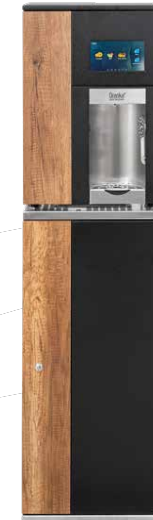
Oranka Tower Medium ECO Oranka Base Cabinet ECO