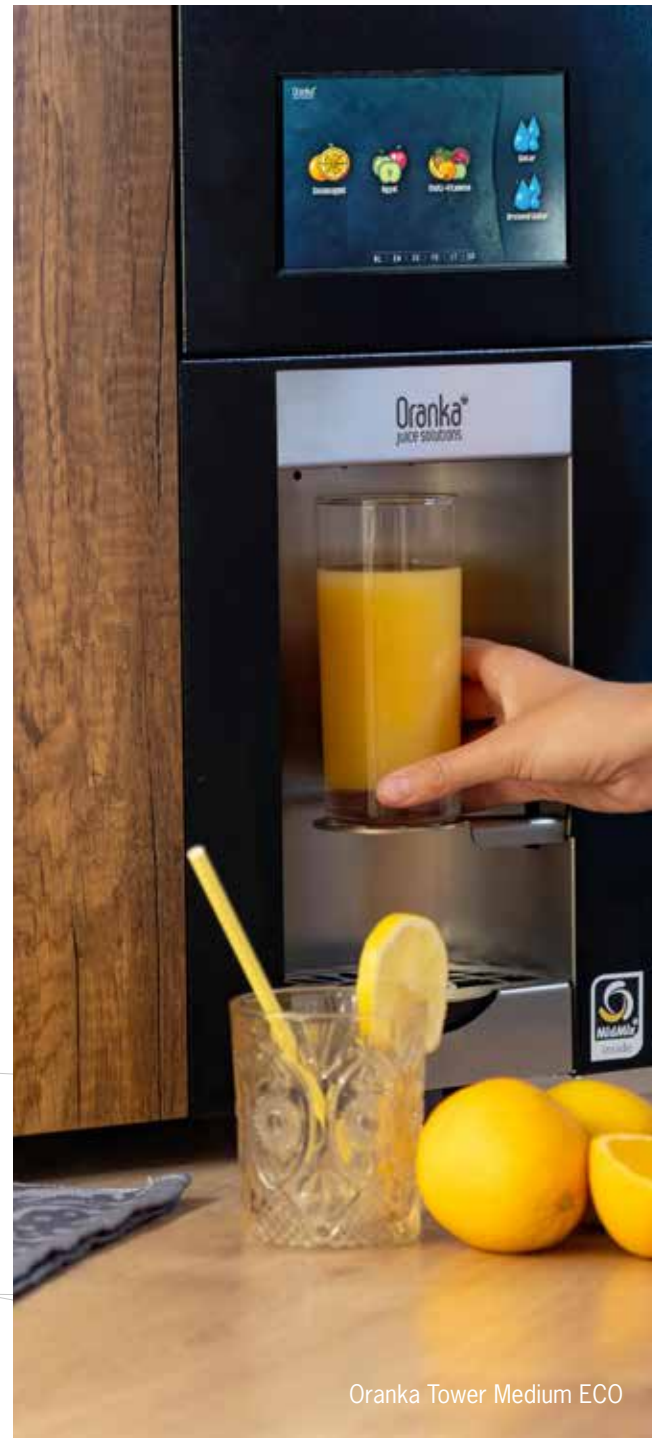
Oranka Tower Medium ECO