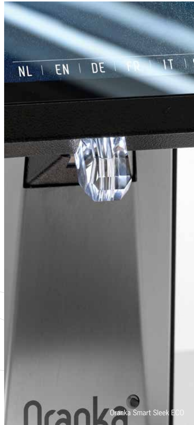
Oranka Smart Sleek ECO